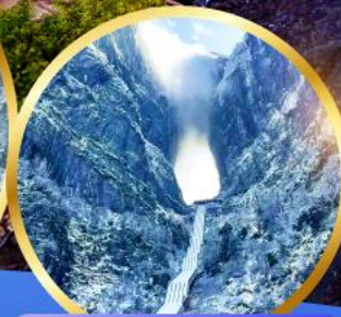
ประตูสวรรค์ เทียนหมื่นชาน